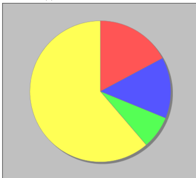
Distribuzione dei docenti a T.I. per anzianità nel ruolo di appartenenza (riferita all'ultimo ruolo)